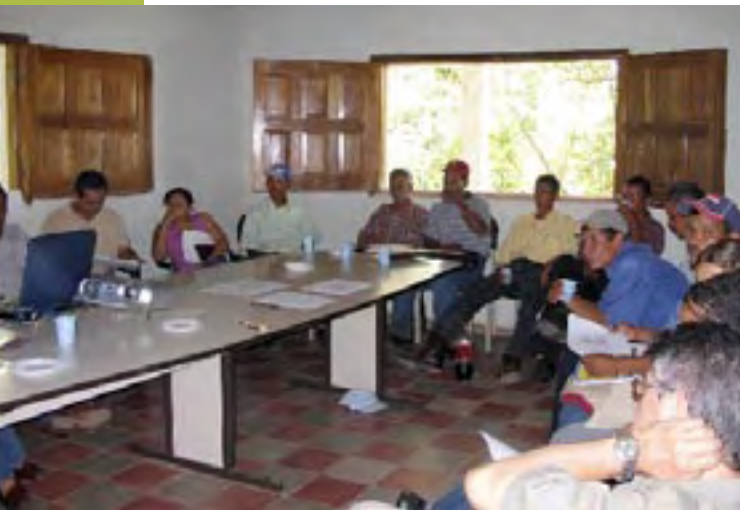
Reunión con los grupos de Gualaco, Olancho.

La institucionalidad se puede estudiar desde dos diferentes escenarios: el contexto del gobierno central y los gobiernos locales.