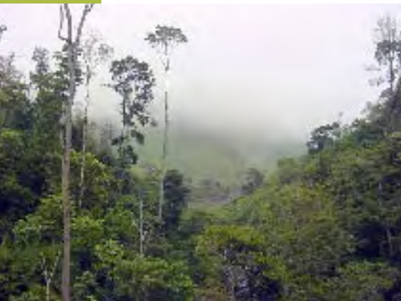
Bosque latifoliado, MAMUCA.

En la práctica, desde el punto de vista de cumplimiento a las normas ambientales, están claramente diferenciadas las actividades ambientales en los planes de manejo, que son conocidos y aprobados por la AFE, y las instalaciones o proyectos forestales, que deben cumplir con lo establecido en el Reglamento del Sistema Nacional de Evaluación de Impacto Ambiental (SINEIA) y, particularmente, en la tabla de categorización ambiental de los proyectos.