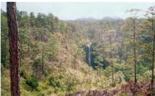
Bosque de pinos en Comayagua.

A demás de las tres leyes forestales propiamente dichas, la legislación hondureña contiene otras legislaciones (administrativas, agrícolas, ambientales, turísticas, etc.) que también regulan aspectos que inciden en el manejo forestal.