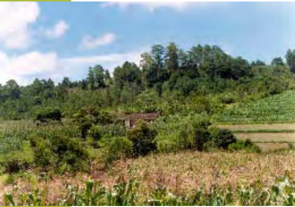
Bosque mixto en Comayagua.

En relación al tema forestal, el actual plan de gobierno (2002-2005) también contempla líneas de política, entre ellas 4 : la transferencia de autoridad, responsabilidad y recursos a los municipios; el fortalecimiento de la capacidad técnica y administrativa a las municipalidades; el fortalecimiento de mecanismos de transparencia, garantía y legalización en la tenencia de la tierra, y el combate a la pobreza y el desempleo en el ámbito local.