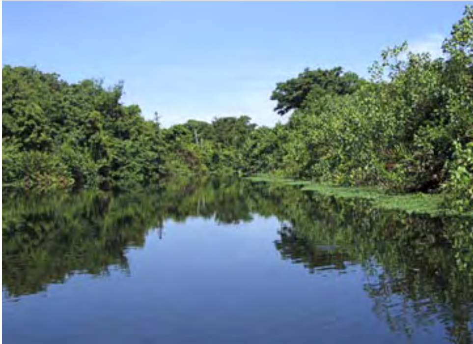
Refugio Cuero y Salado, Costa Atlántica.

protegidas y reafirma el rol de la COHDEFOR y de las municipalidades, en el área ambiental; la segunda es la Ley de Incentivos a la Forestación, Reforestación y Protección al Bosque, Decreto 163-93, que crea una serie de incentivos dirigidos a propietarios privados, cooperativas, empresas asociativas, agricultores, ganaderos, industriales madereros y otras personas; la aplicación de esta ley es competencia de la COHDEFOR, pero a la fecha su aplicabilidad no ha alcanzado los objetivos para la cual fue aprobada.